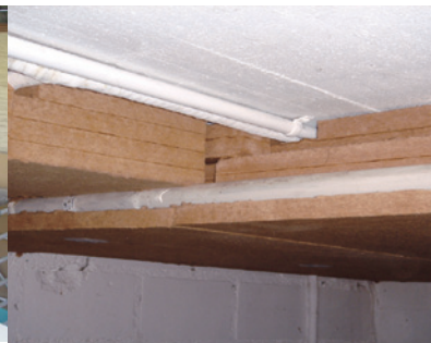
Kellerdecke: Isoliert mit Steicotherm