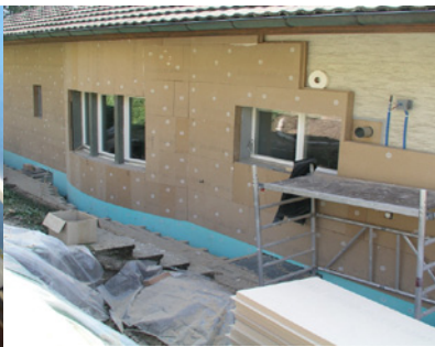
Aussenisolation mit Steicoprotect (Holzfaserplatte)