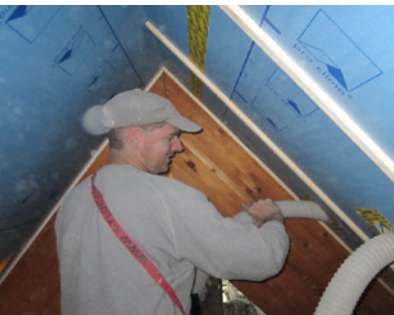
Dachisolation Isofloc (Zellulosefaser)